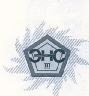
Рис.4 Знак соответствия образца