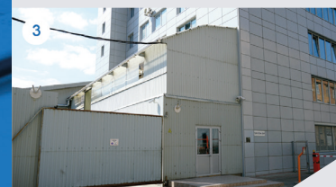
3 СКЛАД / СЕРВИСНЫЙ ЦЕНТР