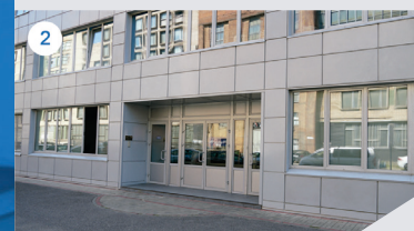
2 ГЛАВНЫЙ ВХОД