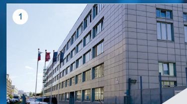
1 БИЗНЕС-ЦЕНТР «ВЗЛЕТ»