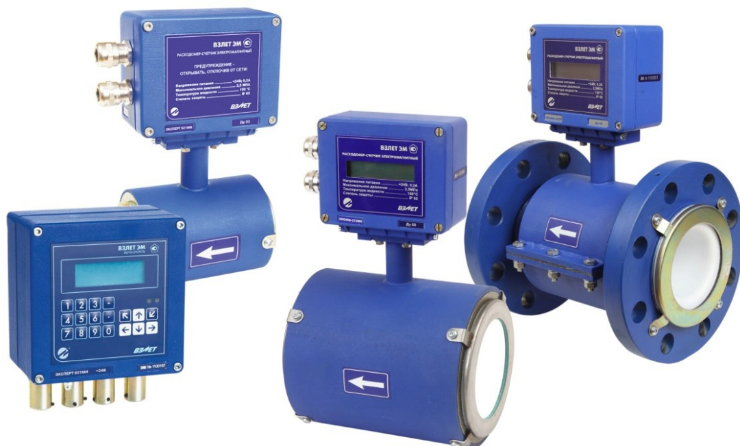
Рисунок 1 – Общий вид расходомеров-счетчиков электромагнитных «ВЗЛЕТ ЭМ»

Общий вид расходомеров-счетчиков электромагнитных «ВЗЛЕТ ЭМ» представлен на рисунке 1.