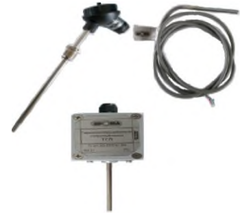
ТСП и ТСП-К