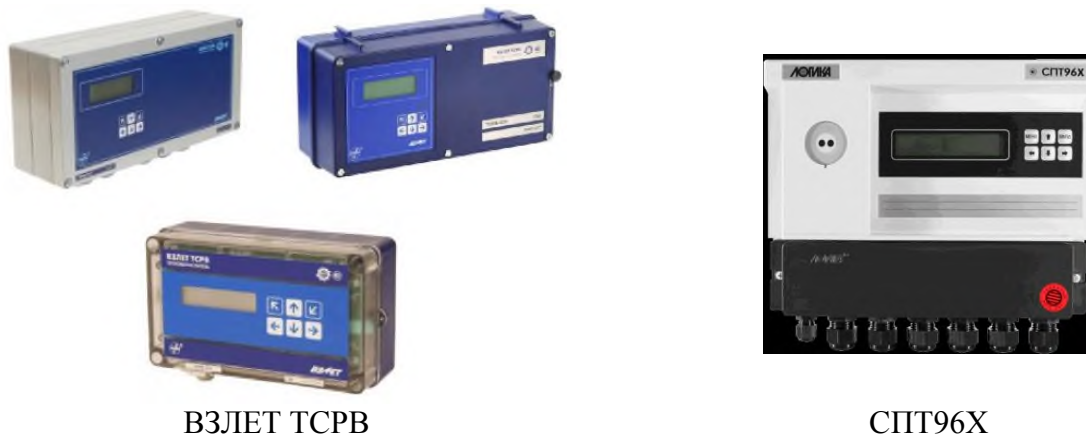
Рисунок 1 – Общий вид и наименование типа тепловычислителей, входящих в состав теплосчетчиков-регистраторов ВЗЛЕТ ТСР-М

Пломбировка от несанкционированного доступа теплосчетчиков-регистраторов ВЗЛЕТ ТСР-М осуществляется в соответствии с требованиями, указанными в описаниях типа средств измерений, входящих в состав теплосчетчиков-регистраторов ВЗЛЕТ ТСР-М.