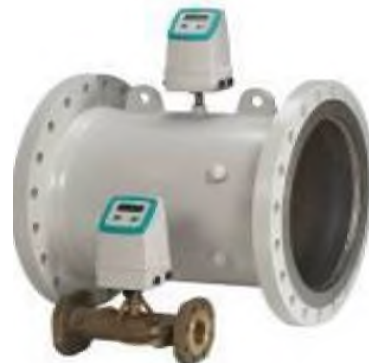
Sitrans F US