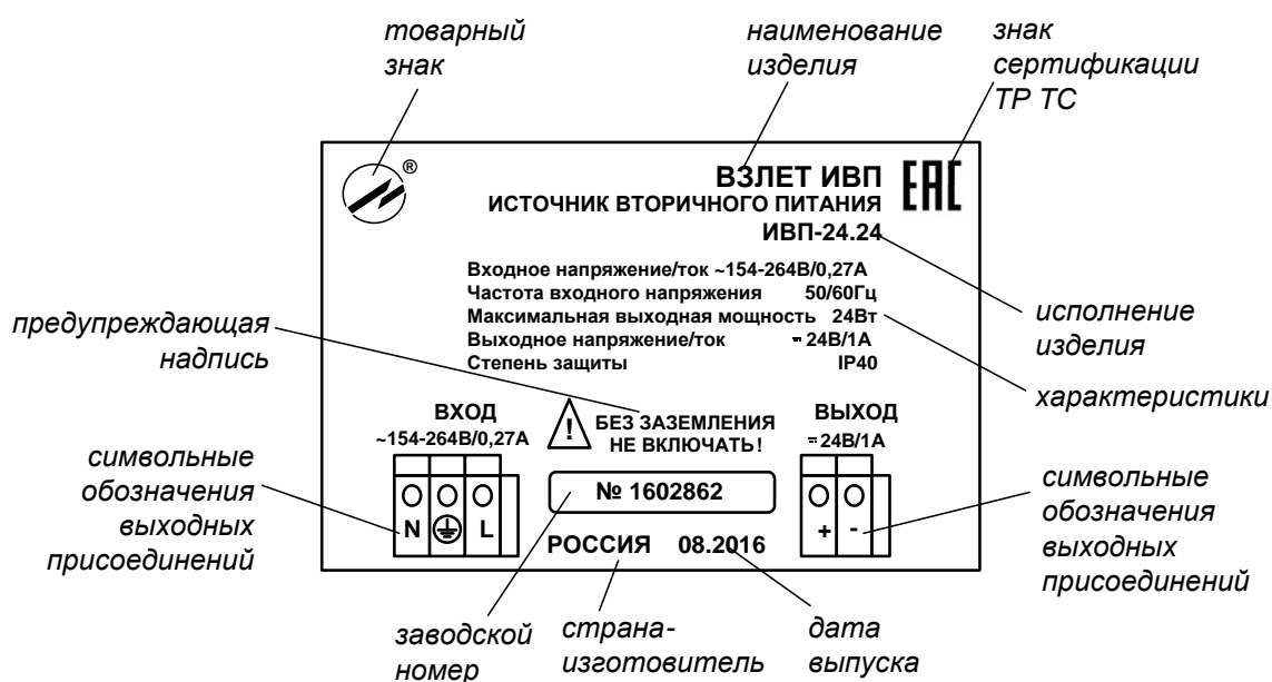
Рис.1. Маркировка изделия.