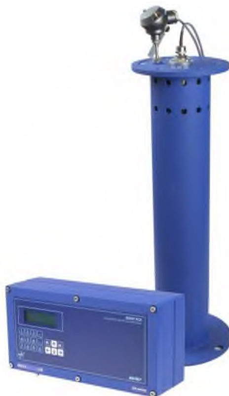
Рисунок 1 – Общий вид расходомеров-счетчиков ультразвуковых «ВЗЛЕТ РСЛ» исполнений РСЛ-212, РСЛ-222

Пломбировка от несанкционированного доступа расходомеров-счетчиков ультразвуковых «ВЗЛЕТ РСЛ» исполнений РСЛ-212, РСЛ-222 осуществляется нанесением знака поверки давлением на пломбировочную мастику, расположенную пломбировочной чашке с металлической скобой, закрывающей контактную пару разрешения модификации калибровочных параметров. Место пломбировки от несанкционированного доступа расходомеров-счетчиков ультразвуковых «ВЗЛЕТ РСЛ» исполнений РСЛ-212, РСЛ-222 в зависимости от исполнений, представлено на рисунке 2.