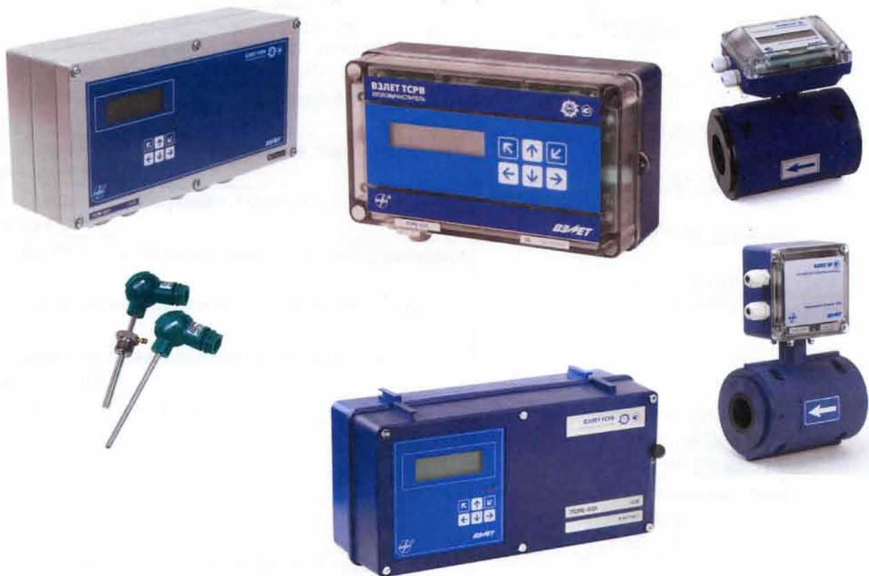
Рисунок 1 - Общий вид теплосчетчиков - регистраторов «ВЗЛЕТ ТСП-М»

Общий вид теплосчетчиков приведен на рисунке 1.