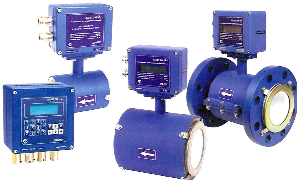
Рисунок 1 – Общий вид расходомеров-счетчиков электромагнитных «ВЗЛЕТ ЭМ»

Общий вид расходомеров-счетчиков электромагнитных «ВЗЛЕТ ЭМ» представлен на рисунке 1.