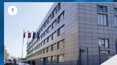
1 БИЗНЕС-ЦЕНТР «ВЗЛЕТ»