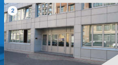
2 ГЛАВНЫЙ ВХОД