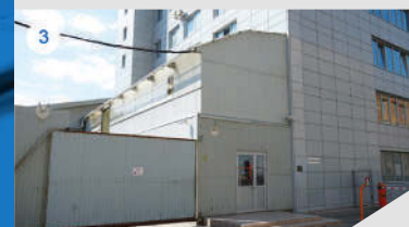
3 СКЛАД / СЕРВИСНЫЙ ЦЕНТР