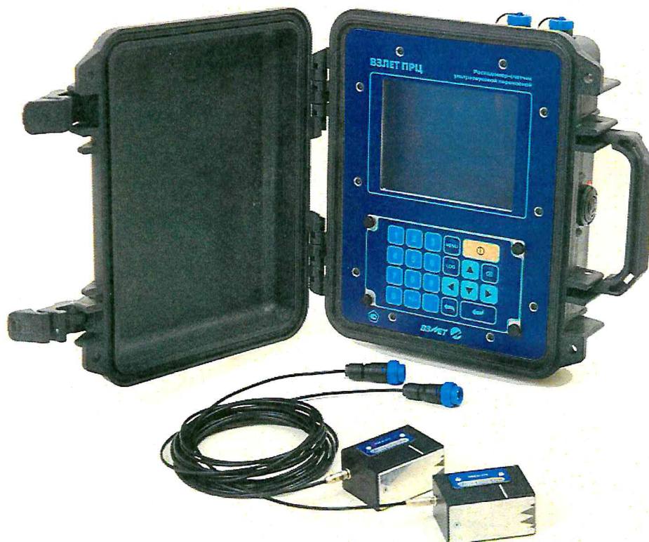
Рисунок 1 - Общий вид расходомеров-счетчиков ультразвуковых переносных «ВЗЛЕТ ПРЦ»

Общий вид расходомеров приведен на рисунке 1.