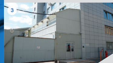
СКЛАД / СЕРВИСНЫЙ ЦЕНТР