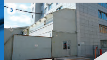
СКЛАД / СЕРВИСНЫЙ ЦЕНТР