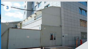
3 СКЛАД / СЕРВИСНЫЙ ЦЕНТР