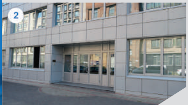
2 ГЛАВНЫЙ ВХОД