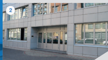
2 ГЛАВНЫЙ ВХОД