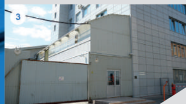
3 СКЛАД / СЕРВИСНЫЙ ЦЕНТР