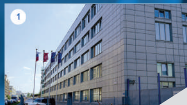
1 БИЗНЕС-ЦЕНТР «ВЗЛЕТ»