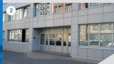
2 ГЛАВНЫЙ ВХОД