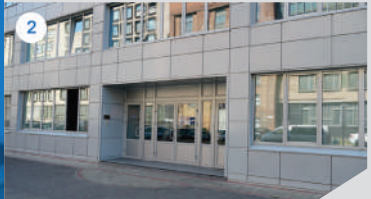
2 ГЛАВНЫЙ ВХОД