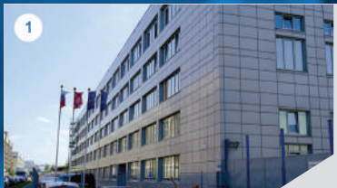
1 БИЗНЕС-ЦЕНТР «ВЗЛЕТ»