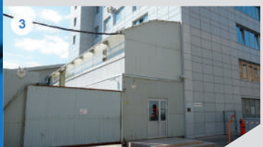
3 СКЛАД / СЕРВИСНЫЙ ЦЕНТР